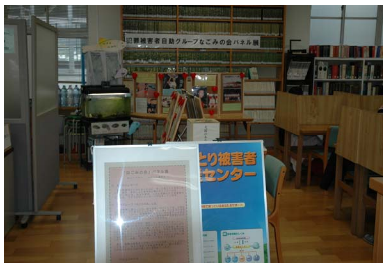
鳥取東高等学校図書館

犯罪被害者の心の支援など、パネルを見た後に考えるべきことは多々あるのですが、私は重苦しい、胸の痛みから次に何と言葉をつなげていいか、とまったままでいます。