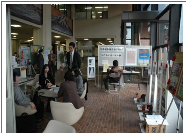
米子市役所でのパネル展